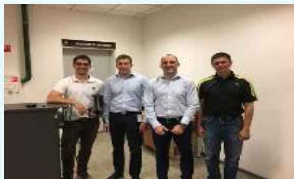
Инструкторы по обучению завода John Deere