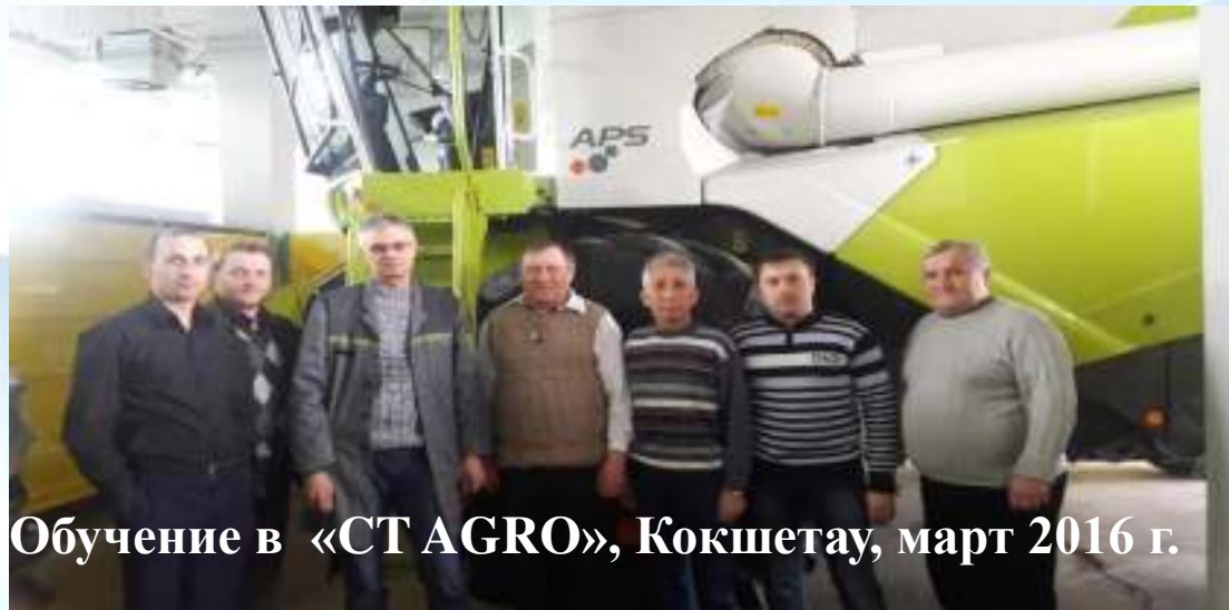
Обучение в «СТ АГРО», Кокшетау, март 2016 г.