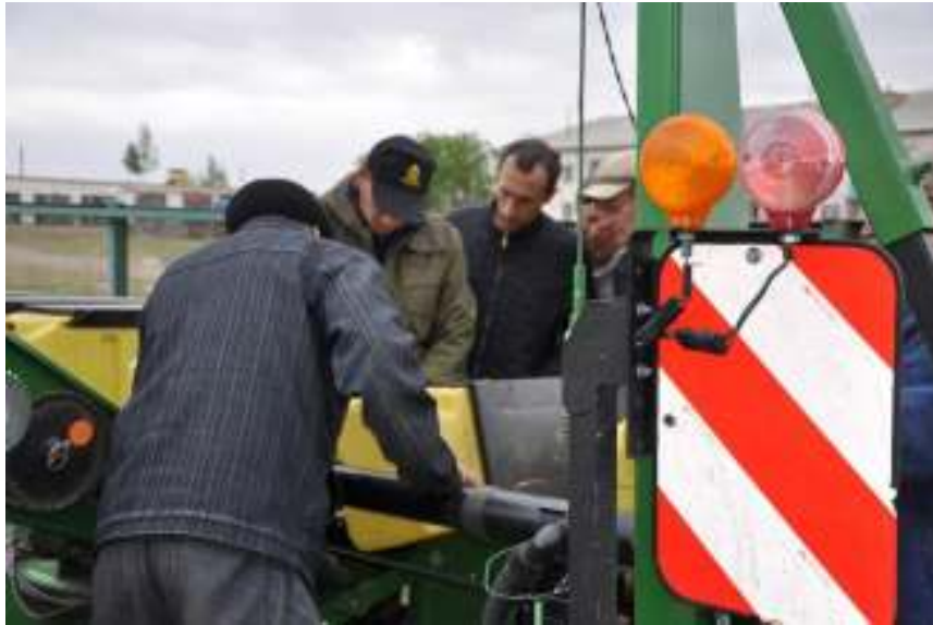
Обучение в «ДАЦ Немац», май 2017 г.