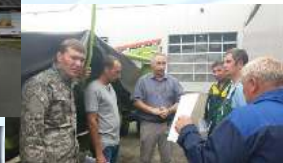
Мастера и преподаватели колледжа