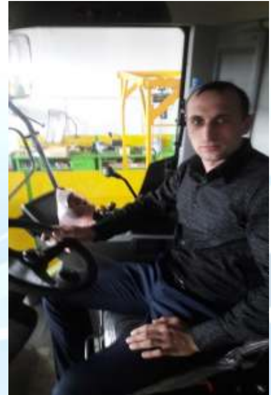
Практика по вождению трактора CLAAS Axion, Кокшетау, май 2016г.